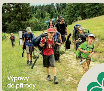
Výpravy do přírody

Zažiješ akci, dobrodružství, zjistíš spoustu nového o přírodě i sobě samém. Učíme se přežít v přírodě i v moderním světě, hrajeme bojovky, řešíme intelektuální problémy a šifry.