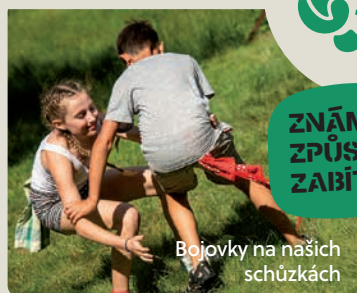
Bojovky na našich schůzkách

Pomáháme v krizích (COVID, válka na Ukrajině) a snažíme se abychom byli prospěšní České republice a demokratické společnosti obecně. Učíme se zdravotědu, abychom byli schopni zachránit člověka v nesnázích.