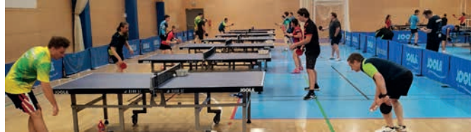
Česko-polské soustředění 9.-14. srpna 2020

Akte stolního tenisu ve svinovské sportovní hale: