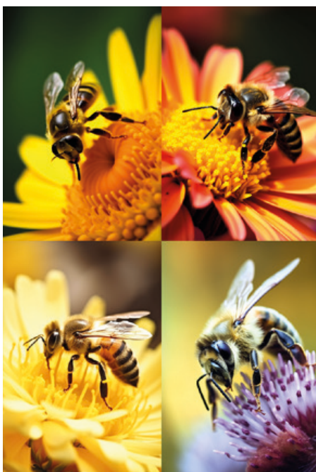
Makrofoto včely na květu

Chat GPT a Midjourney jsou pro účely tohoto článku vhodnými zástupci umělé inteligence. Chat GPT má k dokonalosti