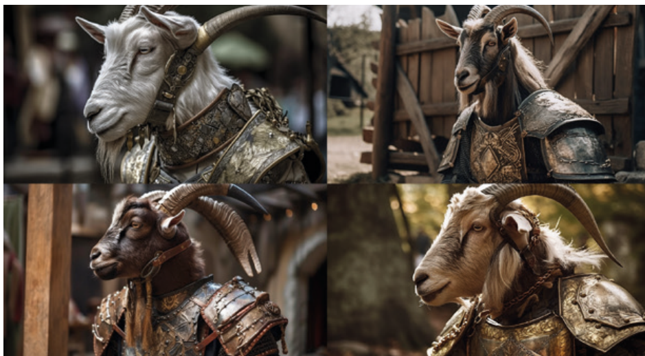
Koza ve středověké zbroji, filmový záběr

Druhou zástupkyní umělé inteligence v tomto článku je grafická aplikace Midjourney. Setkat se s ní můžete na komunikační platformě Discord. Zatímco výše uvedený Chat GPT pracující s jazykovým modelem často dává výstupy, které z pohledu člověka zatím není obtížné intelektuálně převýšit, u Midjourney je situace odlišná. Midjourney generuje obrázky dle zadání uživatele. Postačí několik málo slov a aplikace vygeneruje výstup. Doplnění zadání o nepovinné parametry výsledek ještě zlepší. Uživateli získává bitmapový obrázek prakticky čehokoliv v jakémkoliv stylu. Je možno generovat fotorealistické snímky, grafiky, malby, komiksy reálných i nereálných situací nebo subjektů. Fantazii se meze nekladou. Zadání nemusí být konkrétní. Umělá inteligence si obsah doplní sama. V jednotlivých vláknech, ve kterých probíhá veřejná část generování výsledků tak je možno spatřit obrázky čehokoliv. Od modelek, přes automobily, zvířata, rostliny, domy, krajiny, města, oceány až po jídlo nebo třeba osoby velmi podobné politikům. A to vše v reálných i nereálných situacích, podobách a stylech. Možnosti se zdají být