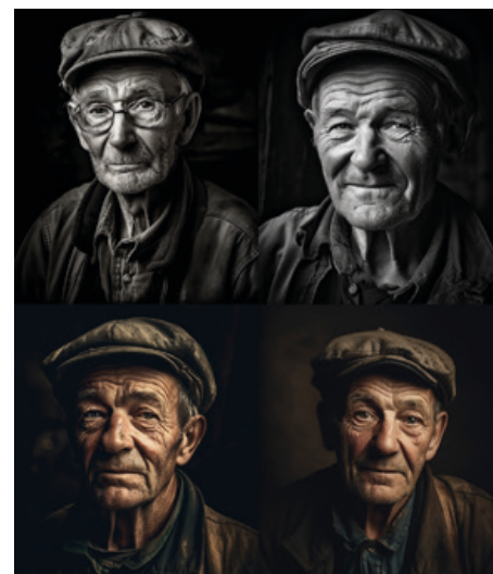
Fotografický portrét starého havíře

Všichni jsme podvědomě předpokládali, že pokud vznikne pokročilá umělá inteligence, její silnou stránkou budou znalosti. Dnes můžeme konstatovat, že její silnou stránkou je kreativita!!! Z lidské psychologie je známo, že kreativita je ve zvýšené míře sledována u patologických lhářů. Skutečnost, že si Chat GPT často vymyslí je pěkným odkazem k základům. Umělá inteligence je postavena na umělé neuronové síti, která se snaží napodobit tu lidskou. Zdá se, že se to povedlo.