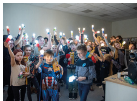
Noc s Andersenem