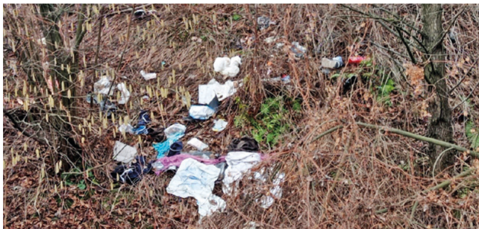
Že občas někomu vypadne z kapsy papírový kapesník...stane se, ale jak musela být asi velká tato kapsa?