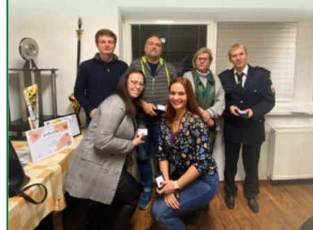
Za SDH Svinov zpracovali: Kristýna Střížová, Jiří Papežík

Základna dobrovolných hasičů ve Svinově má nyní 93 aktivních členů., 21 žen a 38 mužů, 19 chlapců a 15 dívek.