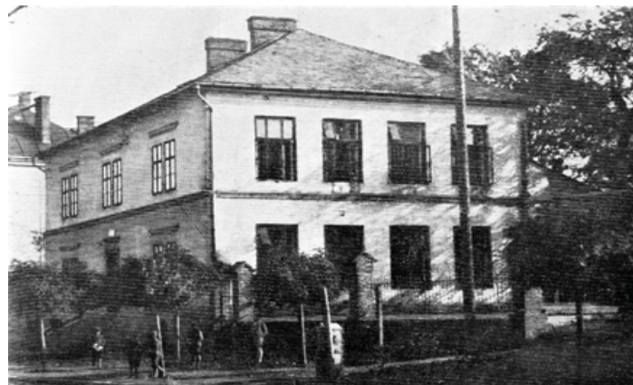
Nová obecná škola, 30. léta 20. století

4. 12. 1912 byla slavnostně otevřena česká škola, která byla vystavěna stavitelem Jožou Dvořákem ze Slezské Ostravy za 227.000 Kč. Ve své době to byla nejpěknější, neprostornější a nejlépe vybavená škol v celém okresu (7 učeben, kancelář, 2 kabinet, tělocvična se šatnou, ústředním topením a dvoupatrovým domem s 6 učitelskými byty).