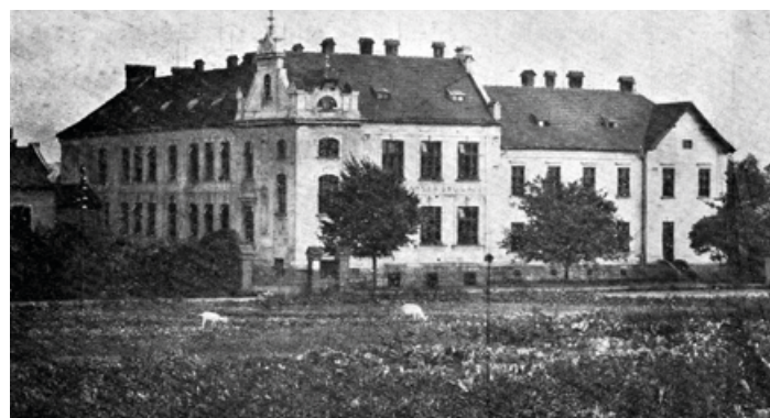
Měšťanská škola před rokem 1938

Ke dni 1. 9. 1941 jsou na německé obecné škole zapsáni 203 děti, na německé měšťanské škole 87 žáků. K tomuto datu bylo provedeno další stěhování škol. Německá Hauptschule byla