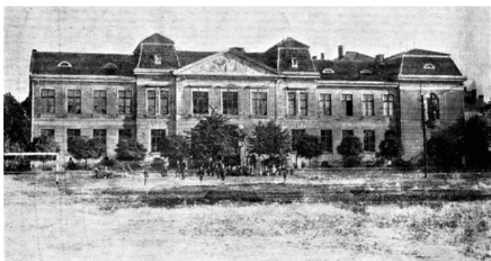
Stará škola, 1910

Dvoutřídní se škola stala v roce 1892, kdy nastal příliv obyvatel do obce v souvislosti s rozvojem místního průmyslu a projevila se nutnost pořídit školu novou, neboť stará už nestačila. Po dlouhých rozepřích kolem nové školy mezi Němci a Čechy v obecní radě byla vystavěna a v roce 1910 otevřena nová česká škola, jejíž výstavba trvala téměř 5 let.