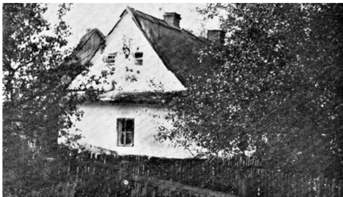
Nejstarší škola do roku 1873

Vyhlášením Všeobecného školního řádu v roce 1774 za císařovny Marie Terezie se podstatným způsobem změnilo školství v celé tehdejší monarchii. Základním úkolem Všeobecného školního řádu bylo vybudování systému veřejných škol, do nichž by děti mohly chodit a poskytnout tak vzdělání veškerému obyvatelstvu.