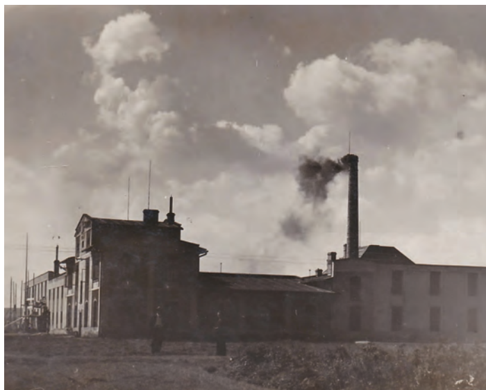
Továrna izolovaných vodivých drátů, konec 20. let 20. století