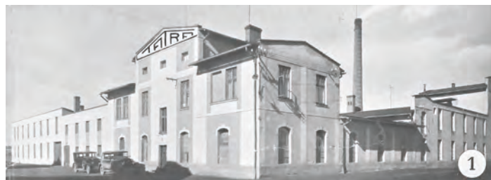
Žárovkárna Tatra, 30. léta 20. století

Díky čínorodosti majitelů se nám dochovalo množství grafických materiálů. Jedním z nejzajímavějších je osmistránková propagační brožura otevřeně zachycující výrobní proces probíhající v Žárovkárně Tatra. Podrobně jsou zde s bohatou fotografickou dokumentací popisovány všechny technologické kroky vedoucí k výrobě svinovské žárovky. Je úchvatné sledovat energii uchovanou v dobových fotografiích. Při jejich prohlížení na nás dýchne něco z atmosféry prvorepublikových filmů pro pamětníky.