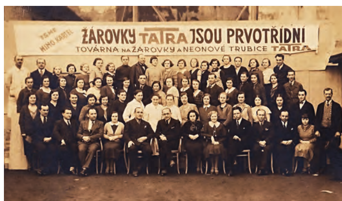
Pracovní kolektiv žárovkárny Tatra,

Díky čínorodosti majitelů se nám dochovalo množství grafických materiálů. Jedním z nejzajímavějších je osmistránková propagační brožura otevřeně zachycující výrobní proces probíhající v Žárovkárně Tatra. Podrobně jsou zde s bohatou fotografickou dokumentací popisovány všechny technologické kroky vedoucí k výrobě svinovské žárovky. Je úchvatné sledovat energii uchovanou v dobových fotografiích. Při jejich prohlížení na nás dýchne něco z atmosféry prvorepublikových filmů pro pamětníky.