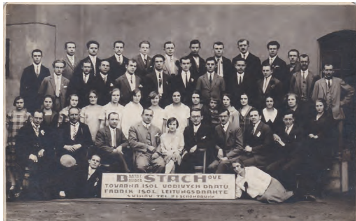
Pracovní kolektiv, 1927