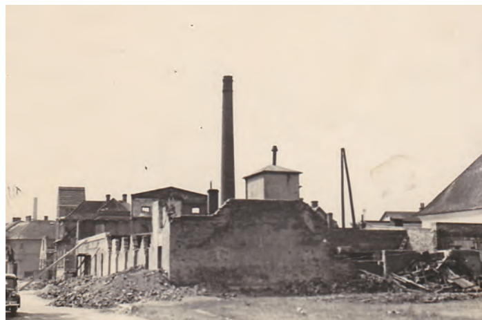
Válečné škody na budově žárovkárny, 1945

„Z větších svinovských podniků, které před okupací nebyly ovládnuty Němci, byla pouze žárovkárna, do níž ještě v říjnu dali Němci svého komisaře Hanse Gerulla, rodáka z Dačic na jižní Moravě. Majiteli žárovkárny byli i nadále Stachové. Gerull ovšem se chtěl zmocnit žárovkárny pro sebe. Proto nalíčil na jednoho z majitelů žárovkárny nástrahu. V nestřeženém okamžiku vsunul mu do kapsy nákras žárovky určené pro německé ponorky. Postižený