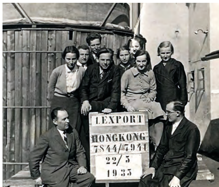
Exportní balení pro Hongkong