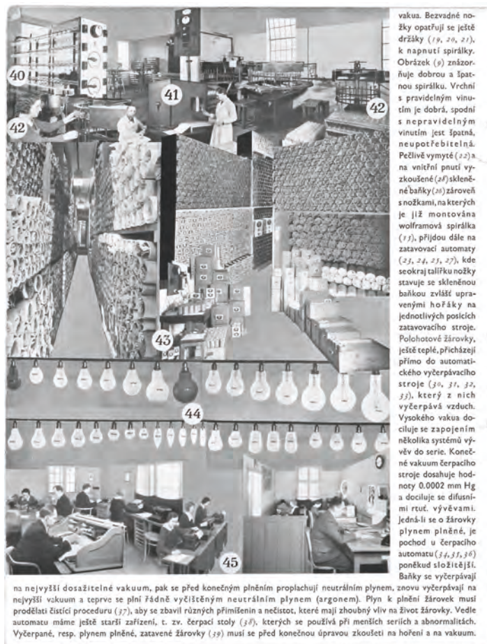
Výrobní sortiment dle reklamní brožury