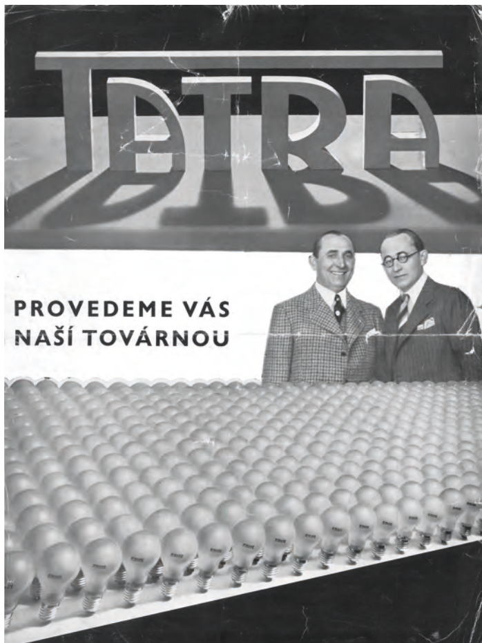
Titulní strana reklamní brožury