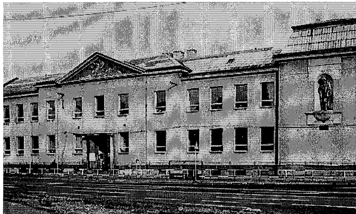
Svinovská škola letos oslavuje úctyhodné jubileum - 80 let.

Redakční rada našeho časopisu by chtěla všem svinovským občanům poskytovat informace o dění ve Svinově. Vyhlásky nejsou vždy všemi čteny, většina občanů nechodí na veřejné schůze ani na zasedání zastupitelstva a není tak informována o dění u nás. Vzniká dojem, že se nic neděje. A přece stačí se poohlédnout pozorněji kolem, a uvidíte, že se přece jen dost vykonalo.